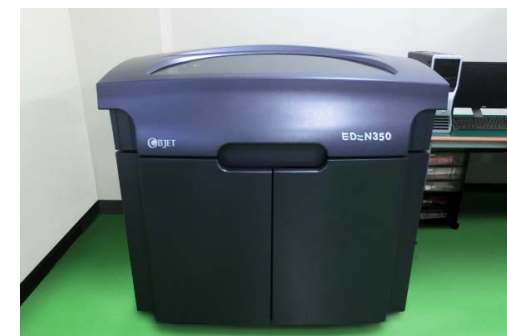
・ 3D プリンター (EDEN350V)