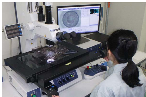
・ 2次元測定機 (測定顕微鏡 MF)